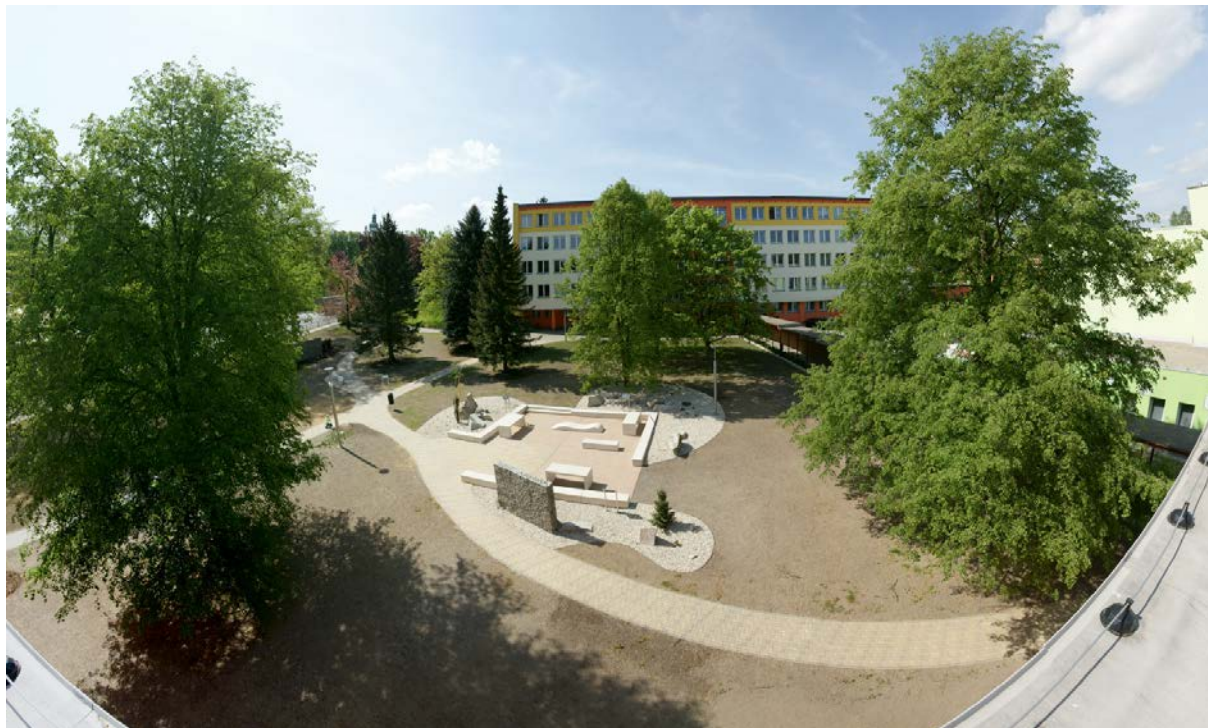
Nový školní park

Další informace o plnění úkolů jsou podrobněji zpracovány v dokumentu: Výroční zpráva o činnosti školy 2017 – 2018.