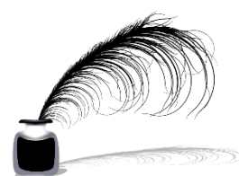
Poezie našich žáků.....15