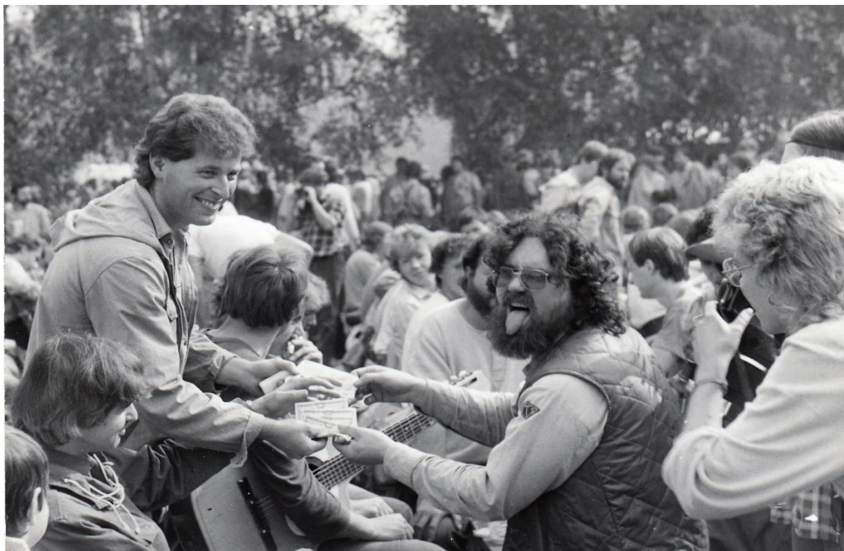
rok 1987, festival ve Svojišicích.

Octnete-li se na koncertu nějakého mladého písničkáře či nekonformní kapely nebo v obecnstvu některého z těch dnešních malých divadel, máte pocit, že mladí lidé, které tam vidíte, žijí v jakémsi svém vlastním a docela jiném světě, než jaký na vás dýchá třeba z novin, televize či pražského rozhlasu, že se ty dva světy prostě osudově míjejí, v jistém ohledu daleko radikálněji, než jak se míjelo analogické dění šedesátých let se světem tehdejší ideologie.“