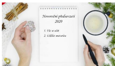
Předsevzetí do roku 2020.....4